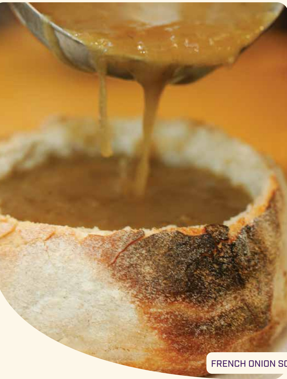
FRENCH ONION SOUP