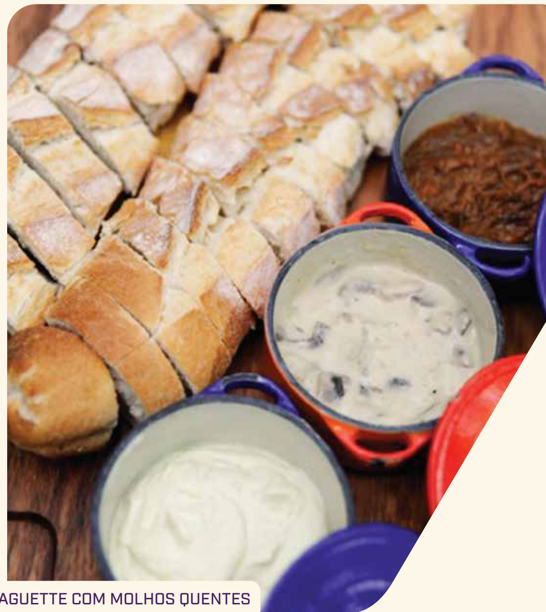
BAGUETTE COM MOLHOS QUENTES

COGUMELOS AO CREME - R$ 20,60 - Porção de 200g. Molho de nata com cogumelos Shitake e Paris.