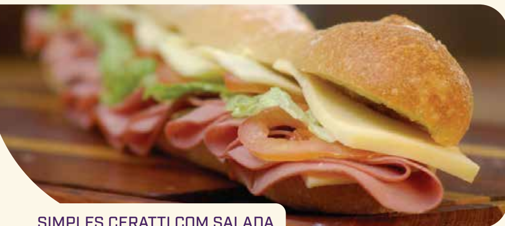
SIMPLES CERATTI COM SALADA

Baguette integral, catupiry, peito de chester, tomate e alface americana.