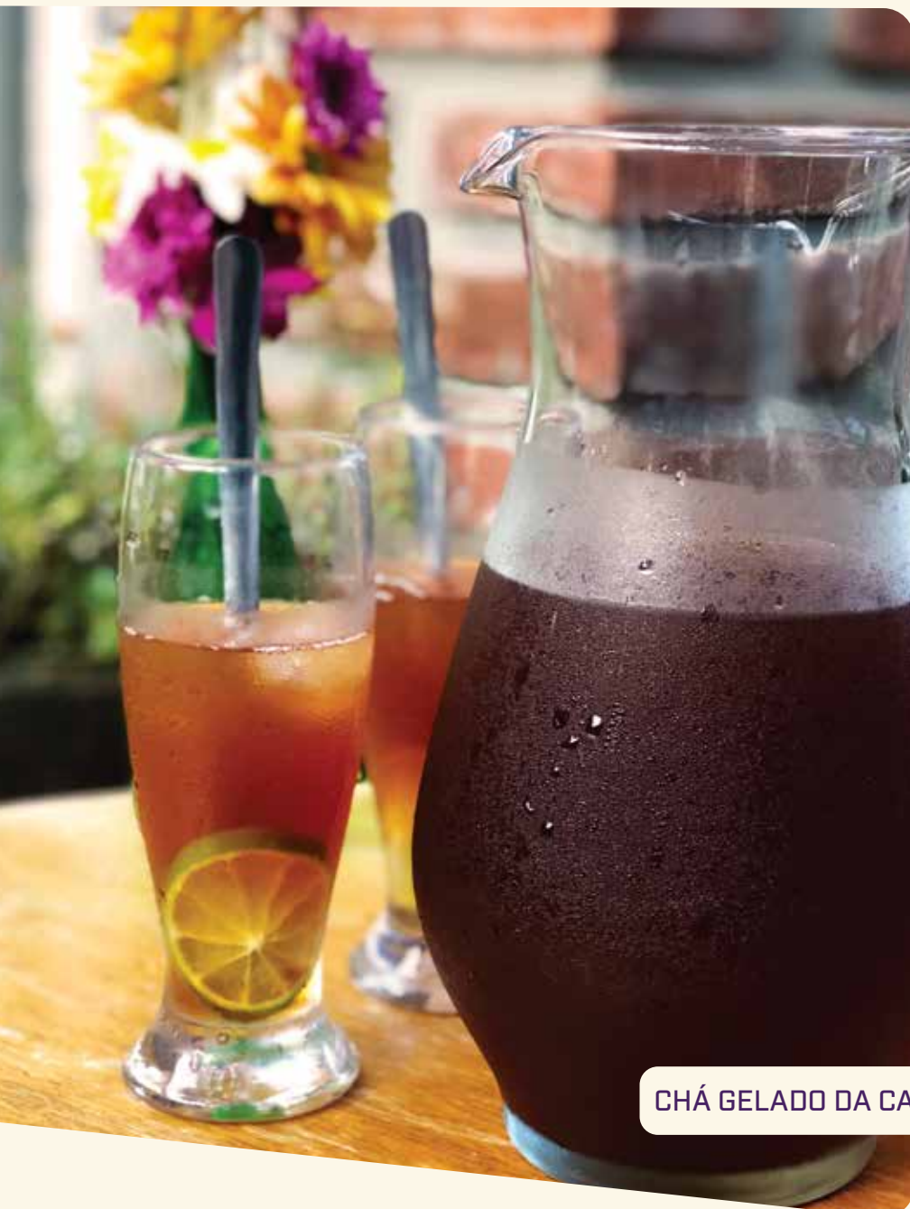
CHÁ GELADO DA CASA