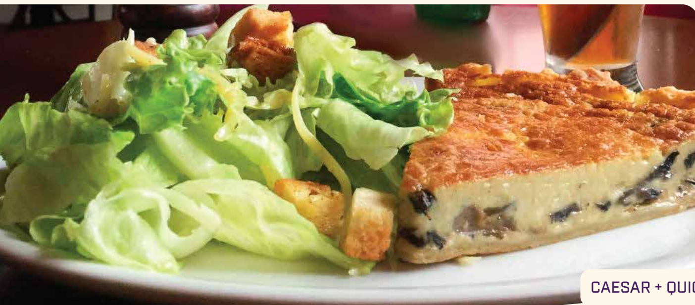
CAESAR + QUICHE

Massa crocante e folhada, recheada com nosso maravilhoso frango pomodoro e gota de catupiry no topo - R$ 6,00