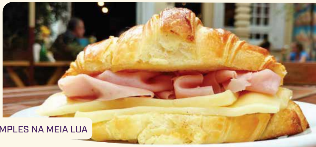
SIMPLES NA MEIA LUA