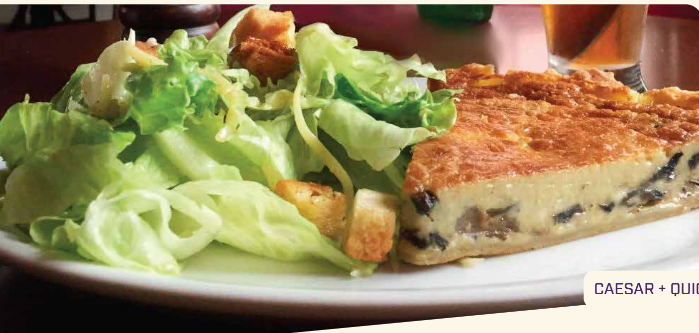
CAESAR + QUICHE

Massa crocante e folhada, recheada com nosso maravilhoso frango pomodoro e gota de catupiry no topo - R$ 6,00