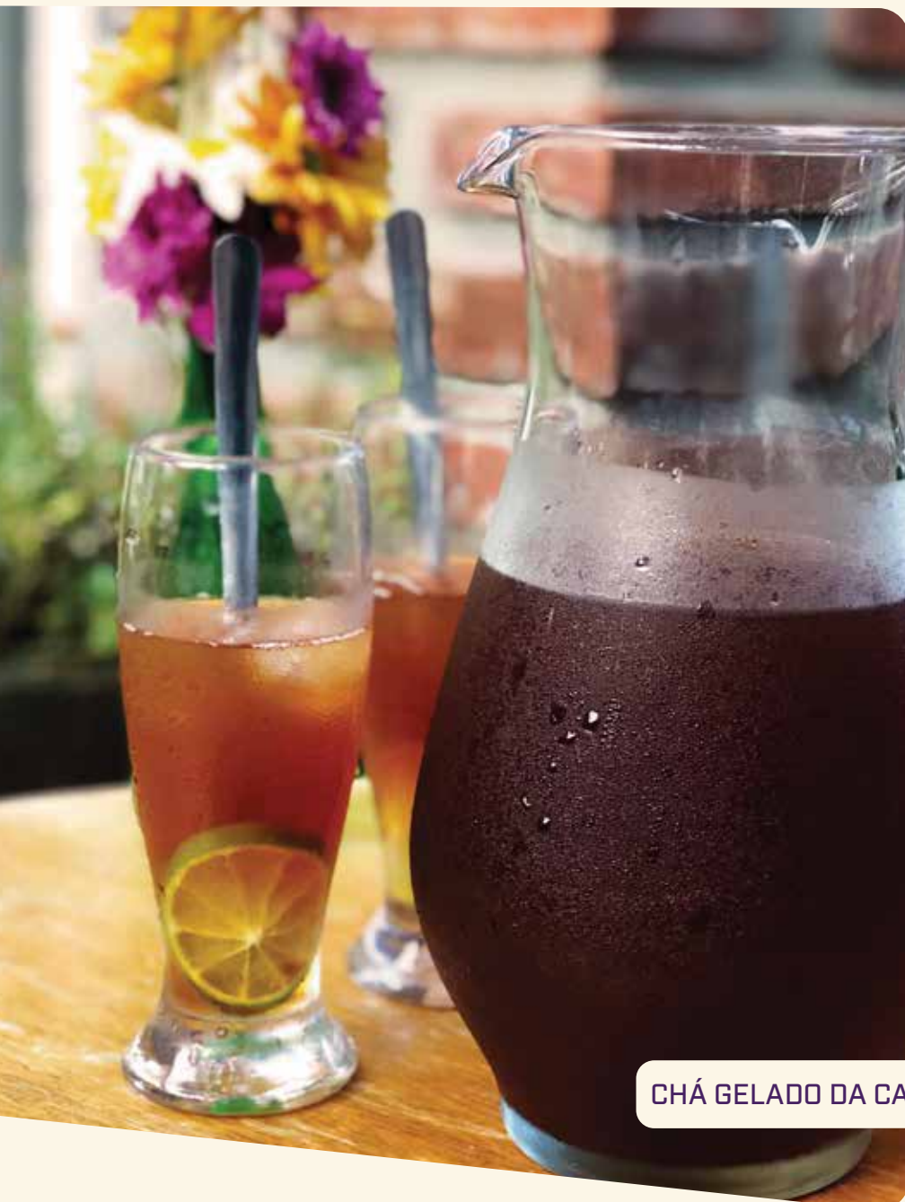
CHÁ GELADO DA CASA